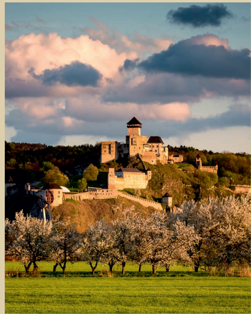
Trenčiansky hrad – Stanislav Hladký