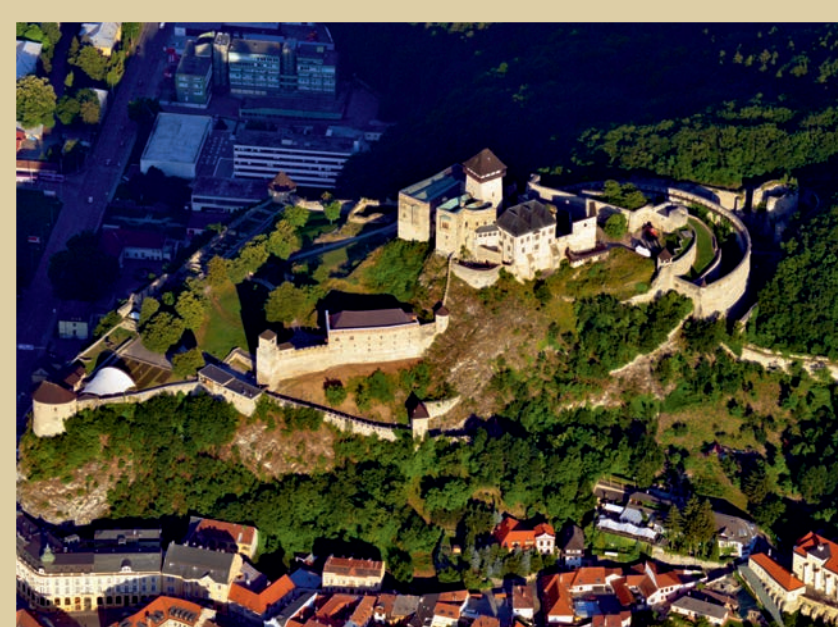
Trenčín z vtáčej perspektívy – Michal Jambor

Rímsky nápis na trenčianskej skale uvádza najznámejší názov - Laugaricio, nápis z alžírkej archeologickej lokality Zana hovorí o Leugaricio a v Ptolemaiovej mape sa spomína obchodná osada Leukaristos.