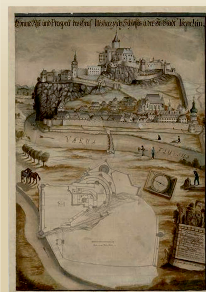
Trenčín v druhej polovici 17. storočia

Zamyslenie Vojtecha Zamarovského: „Jedna z vecí, ktoré ma fascinovali, bol rímsky nápis na trenčianskej hradnej skale. Otec ma k nemu priviedol hneď ako som vedel čítať. Postupne som si uvedomil tú hĺbku dejín v Trenčíne a začal som študovať. Došiel som až k tomu, že naši učitelia boli Rimania a tí mali ešte učiteľov Grékov, ktorí mali za sebou ešte staršie národy: Babylončanov, Asýřčanov, Egypťanov, Sumerov a tak som sa dostal až k nim.“