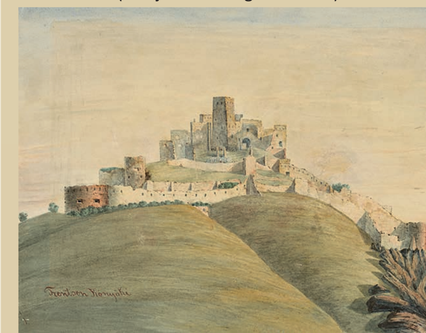
Trenčín cca v roku 1860