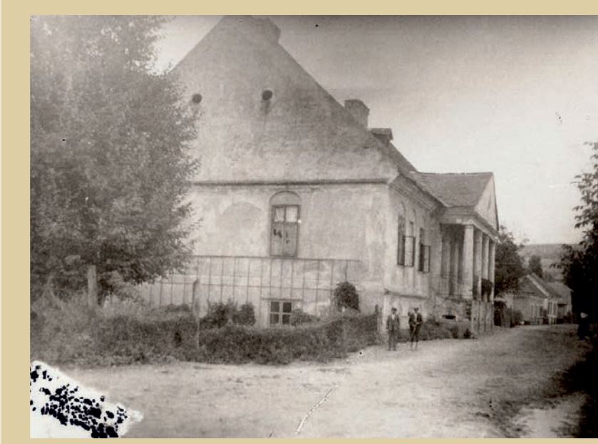
Kaštieľ – celkový záber v roku 1930