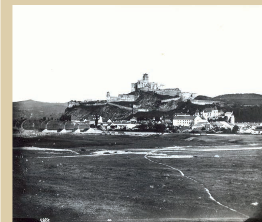
Trenčín okolo roku 1889