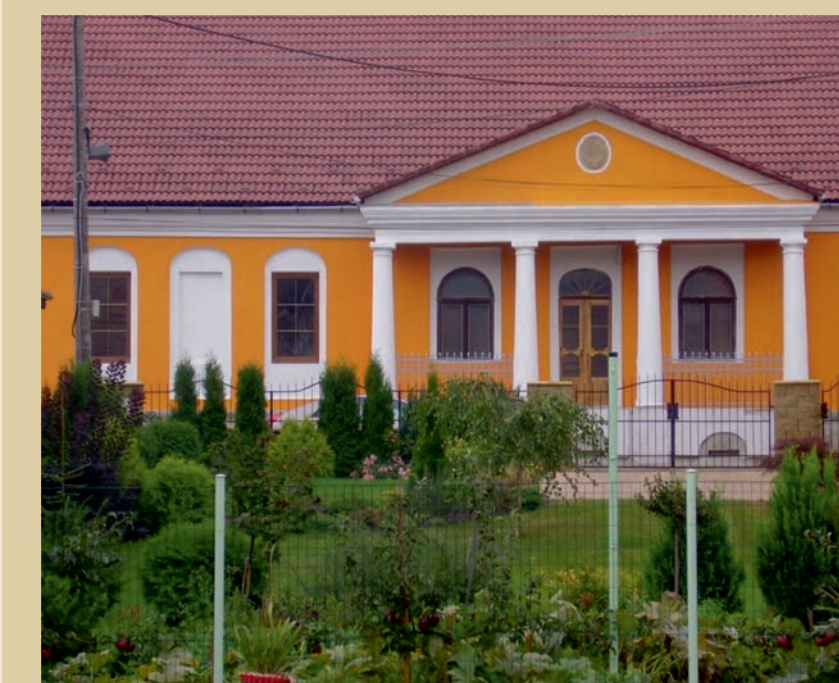
Kaštieľ po oprave fasády v roku 2005-2006