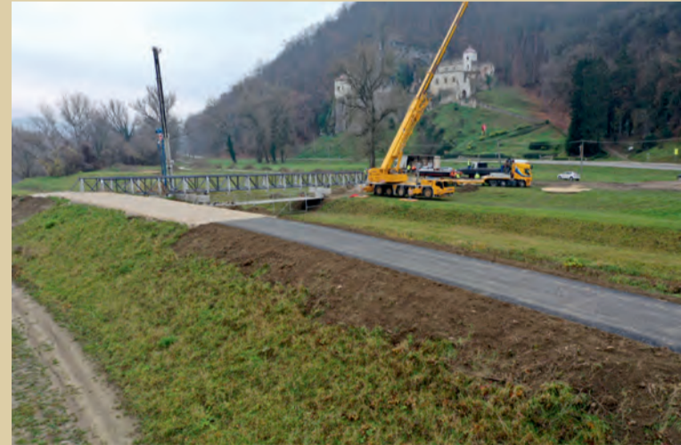
Príprava napojenia lávky na cyklotrasu