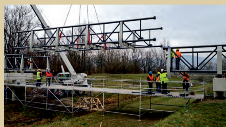
Osádzanie lávky cez potok Sučanka