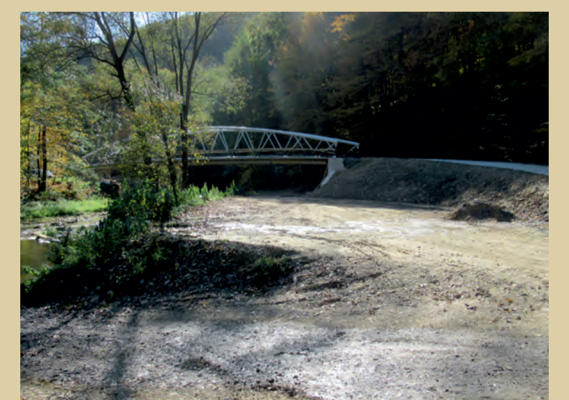
SO 205 v priebehu