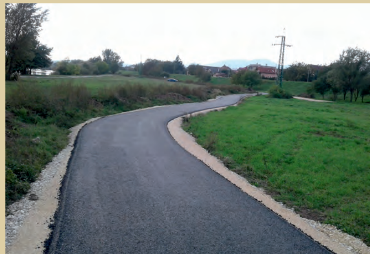
Prvé kilometre novej trasy

Prechádzate cyklotrasou ktorá bola vybudovaná z projektu „Na bicykli po stopách histórie“. Základnou myšlienkou projektu bolo vybudovanie novej cyklotrasy a jej napojenie na BEVLAVU (BEČVA-VLÁRA-VÁH) s cieľom cykloturistického prepojenia Trenčianskeho hradu s Hradom Brumov. Vďaka tomuto prepojeniu nesie projekt podtitul „Od Hradu k Hradu“.