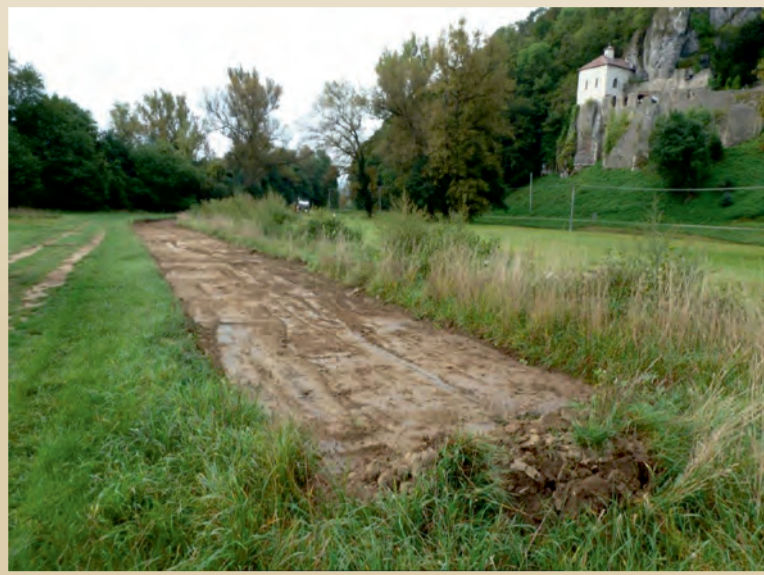
Odstaňovanie trávnatého porastu