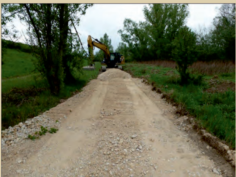
Odhumusovanie a rovnanie pláne podložia