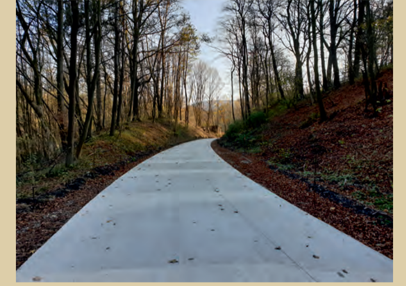
Rozostavaný úsek medzi SO 204 a SO 205