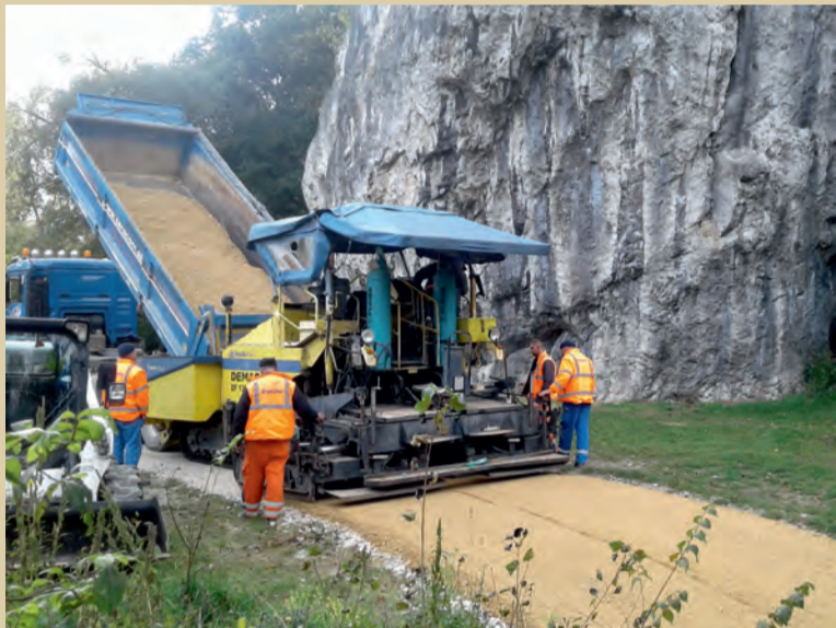
Kladenie konštrukčných vrstiev cyklotrasy