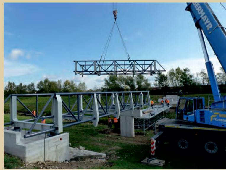
Osádzanie lávky cez rieku Vlára