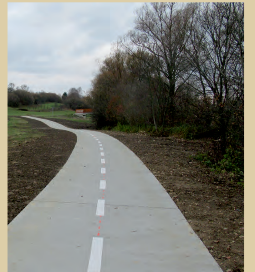
Bylnice – pohľad smerom na lávku za pílu