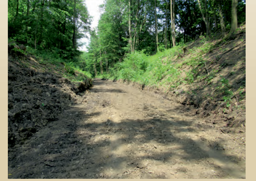
Cyklotrasa v začiatkoch výstavby