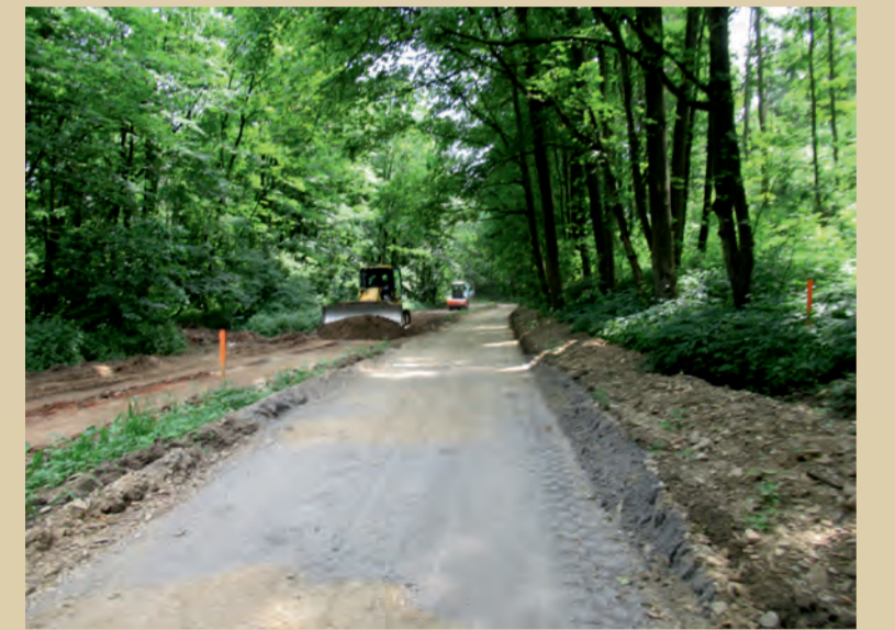
Príprava podložia – zemné práce