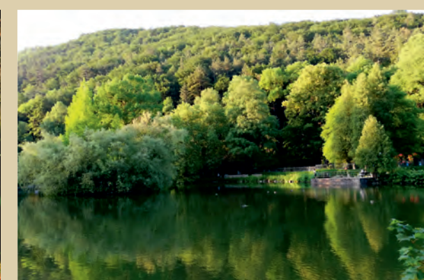
Park Trenčianske Teplice_ Soňa Bezdedová