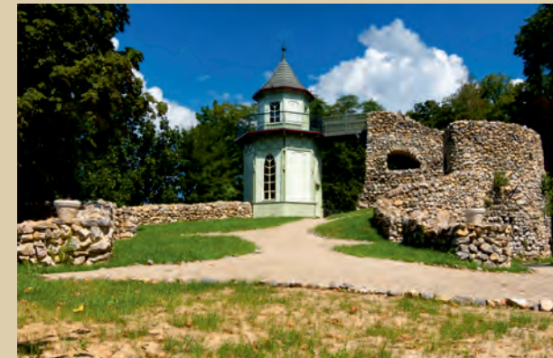
Grotta – Vladimír Ronec