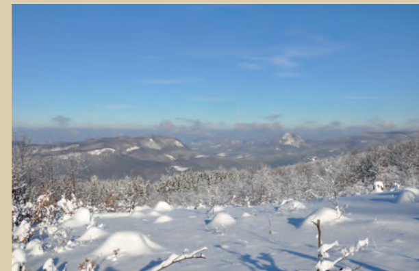
Výhľady z Baske