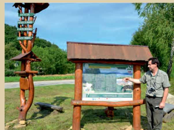
Náučný chodník Ľuborčianskou dolinou