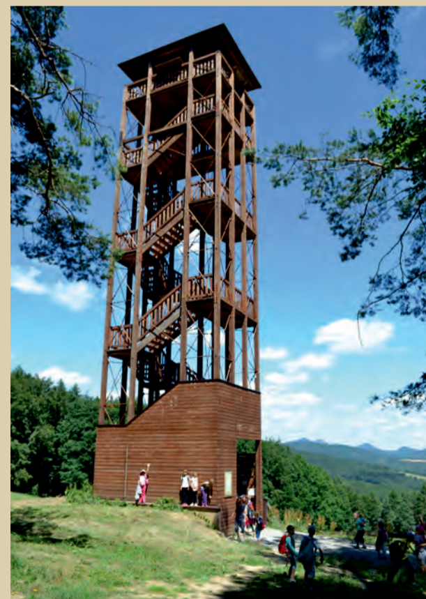
Vyhladková veža v Trenčianskej Závade